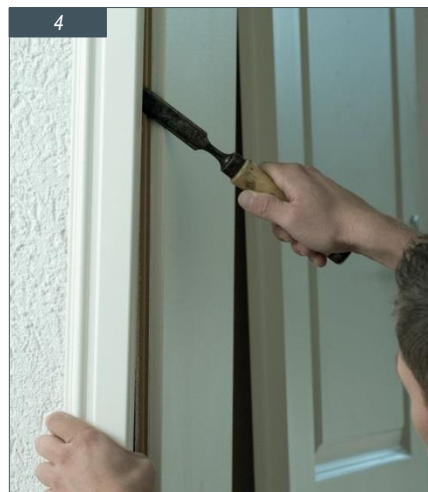
Pomoću dlijeta skinite ukrasnu letvicu.