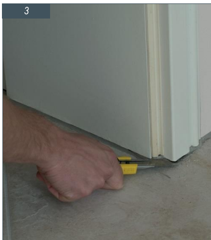
Jednako postupite s eventualnim silikonskim fugama na podu.