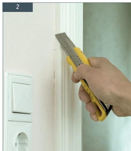
Kako ne biste prilikom demontaže dovratnika oštetili tapete, skalpelom oprezno zarezite uzduž dovratnika.